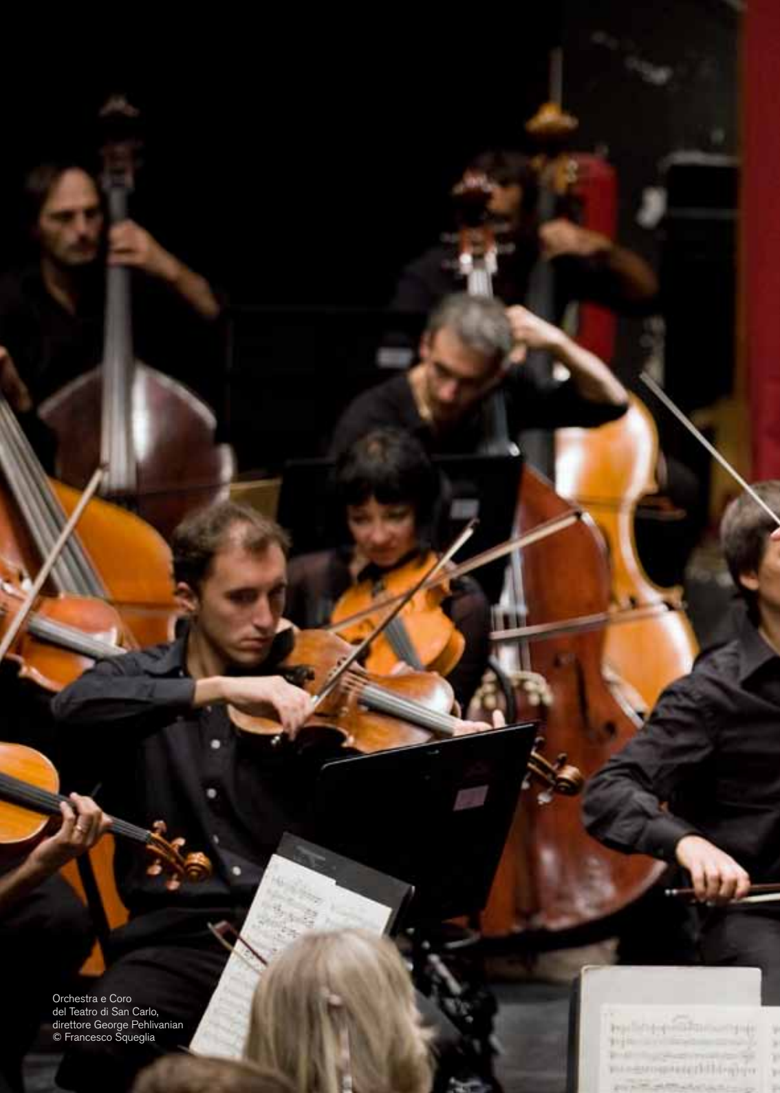
Orchestra e Coro del Teatro di San Carlo, direttore George Pehlivanian